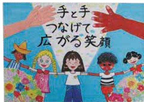
昨年度ポスター展の作品から