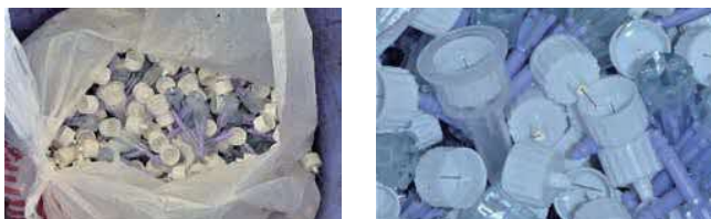
「資源」と一緒に出された注射針