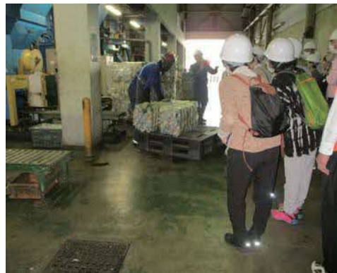
ペットボトルのペール見学