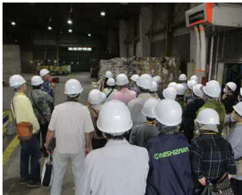
古紙のペール見学