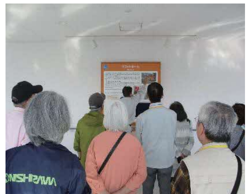
清掃工場内を見学