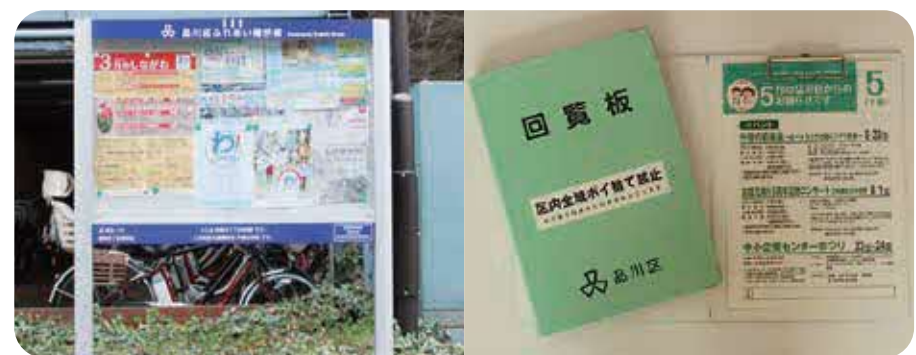
毎月、区の情報を統合ポスター（掲示板）と統合チラシ（回覧板）でお知らせします