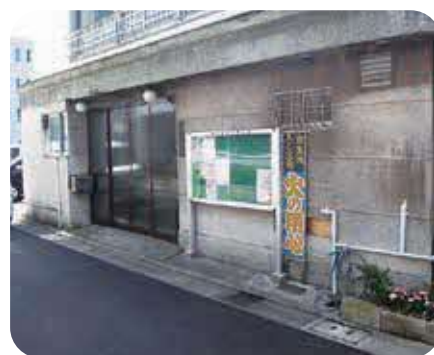
町会会館建設などに助成します

品川区は町会・自治会の自主性・主体性を尊重し、町会・自治会の活動の活性化を推進するために、加入促進活動への支援をはじめ、活動や運営に関する支援策を積極的に推進します。