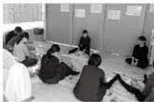
(北品川第二保育園内)