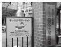
▲ピンクの看板が目印です

児童センター、区立保育園・幼稚園では、妊 娠期から気軽に相談したり、同じ悩みを持つ 仲間同士で交流・情報交換できる身近な施設 「チャイルドステーション」として子育て を支援しています。 そのほか、児童セ ンターでは授乳や オムツ交換ができ る場として、気軽 に利用したり、子 育て相談や身体 測定ができます。