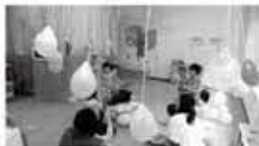
(荏原保健センター内)