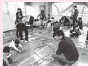
パパと児童センターで思いっきりブラ電車遊び▶