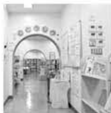
▲児童コーナー(二葉図書館)