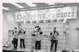
◀ぎゅりあんで開催 「品川子育てメッセ2023」