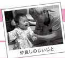
仲良しのじいじと