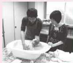
両親学級で 沐浴体験