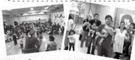
は自分を指さして「おっ、おっ、ニコリ」(笑)

児童センター主催の運動会は、0～3歳までの子どもたちが集まっているので、娘の成長がわかったり、普段は会うことのないパパ同士の会話もでき、いい情報交換の場に。また、親子クラブでは、家とは違った娘の顔を見ることができて、新しい発見がいっぱい! 子ども一人一人に個性があり、その笑顔、仕草に癒されます。(大井在住・3歳女の子の父)