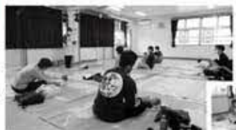
▲ベビーマッサージ パパ向け講座もあります

児童センターには何度か来ていましたが、妻にも一人の時間を…と思ってプログラムに参加しました。父親同士で色々話すことができ、とても新鮮で参考になりました。何より、児童センターは職員さんが温かくて、有難い居場所です。(大井在住・7か月の父)