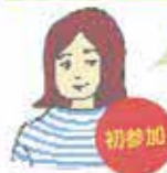
荏原在住 男の子 3ヵ月

品川区の子育てアプリで知りました。今日は赤ちゃんの足型カード作りで、息子のあんよもきれいに取ってもらい、良い記念になりました。そして何より、他のママさんたちとおしゃべりしたり、笑ったり…久々にリラックスできたなって…。コロナ禍で孤独な産後を過ごしてきて、一人で色々考えちゃって。少し疲れ気味だったかも。区の前輩ママが運営しているとのこと、同じ気持ちで話を聞いてもらえて安心しました。やっぱり人と話すのって大切ですね。