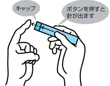
針で指先などに小さな穴を開け、にじんだ血液を専用のシートなどで採取します。

国内では、これまでこの器具を複数人使用することによる感染症の発生は報告されていませんが、該当する医療機関で穿刺器具で採血をした方は、受診した医療機関か保健所、保健センターにご相談ください。 ※複数人使用が認められた医療機関は保健所、保健センター、区ホームページで確認できます。