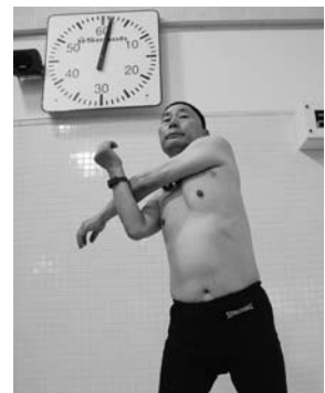
プールに入る前には必ず準備体操を