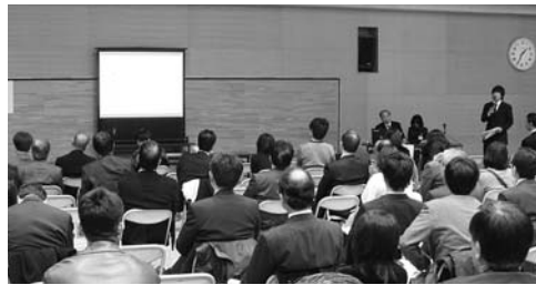
五つのテーマで行われた分科会