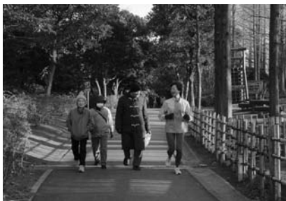
ジョギング中の体育指導員の先生と会う