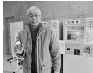
利用券はカード式のタイプ