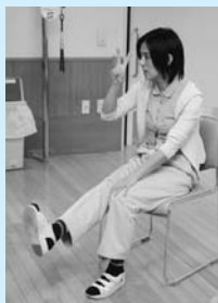
リハビリ指導は理学療法士の先生が行う