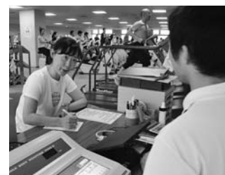
品川健康センターの体力測定はフリー利用のフロアで随時受け付け、無料(入館料500円は必要)。必要事項を記入し測定へ