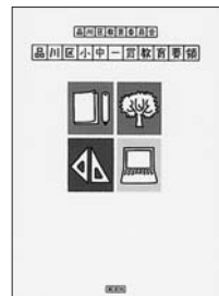
『品川区小中一貫教育要領』

品川区では小・中学校の学びや生活指導の接続をスムーズにしていくことを目的に、全国に先駆けて平成18年度からすべての小・中学校で小中一貫教育を実施しています。義務教育9年間の教育課程を4-3-2年の三つのまとまりで編成した『品川区小中一貫教育要領』に基づいた、区独自の教育を進めています。子どもたちが社会で力強く生きていける力を身に付けられるよう市民科を新設したり、教科指導でも様々な工夫をしています。