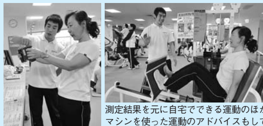
測定結果を元に自宅でできる運動のほか、マシンを使った運動のアドバイスもしてくれる