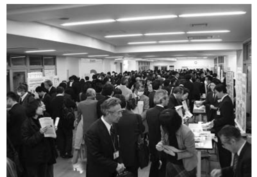
全国の学校や自治体の取り組みの発表(ポスターセッション)で意見交換する参加者

科会終了後、全国の学校などが30のブースでそれぞれの取り組みを紹介するポスターセッションと国立教育政策研究所が2年間にわたり全国の小中一貫教育校の施設について研究してきた成果に基づく特別分科会「学校施設」が開かれました。参加者は自分たちが抱える課題や実情に応じ、それぞれのブースで熱心に質問したり、特別分科会で小中一貫校の施設はどうあれば良いのかを学んだりしており、小中一貫教育を切実な課題として受け止めている様子がわかりました。