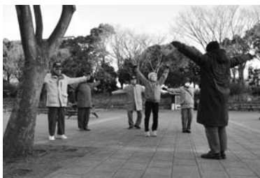
途中「噴水広場」で軽く運動

1周約2km。はじめは正直自信がありませんでしたが、緑の中を歩くのは気持ちが良く、途中で体操などをしながらゆっくり自分のペースで歩き、約50分で1周することができました。また仲間と一緒にというのも効果としては大きいですね。今回はひざの手術をしてリハビリをかねて歩くという女性と一緒にでしたが、彼女の姿は励みになりました。なんでも手術後はやっと歩ける程度だったのが、ここまで回復したそうです。区民公園には早朝、ラジオ体操の行われる時刻にあわせてウォーキングをする人が集まってくるので、興味のある方は参加されてはどうでしょうか。(談/福本章生)