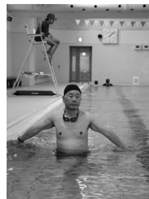
ゆっくり水の中を歩く