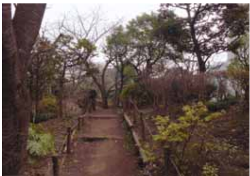
整備された緑道は散策に最適

公園を訪れる人々にとって安全性と快適性というのは大前提となるものです。普段はなかなか気づかないものですが、それを支える地道な努力をしている人がいることは心に留めておきたいものです。