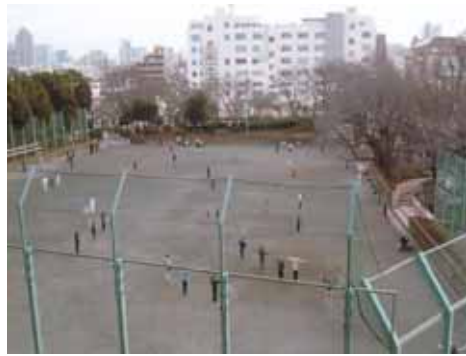
早朝のラジオ体操風景

平日の午前中は概ね決められたグループによる利用が主ということとです。まず、朝の五時半から中国体操。続いて六時半からラジオ体操。八時～十一時はゲートボールが行なわれています。ゲートボールは毎日の練習のほか、春と秋の年一回、大会も開かれており、地域のお年寄りの健康増進と交流の場として賑わっています。