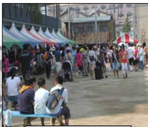
伊藤学園校庭での「合同区民まつり」

今年度の大井第一地区委員会主催事業はまだまだあります。今後の募集予定は... レットトライ(ものづくり) 10月予定 地域清掃(伊藤学園・大井町) 11月14日予定 ユニセフ募金活動(大井町駅周辺) 12月予定 親子参加「雪あそび」 2月予定 学校からの配布・町会掲示板への掲示・回覧板で、お知らせいたしますので、募集期間をご確認の上、ご参加ください。 地区委員一同、各行事ともたくさんのご参加をお待ちしています。行かなきゃソンソン、ごさいます。【石川恵】