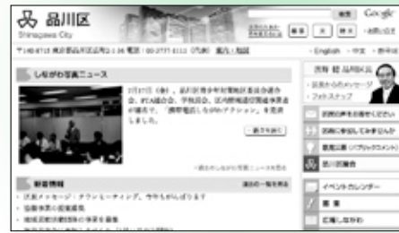
品川区ホームページのトップ画面