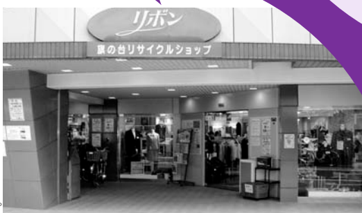
リサイクルショップ