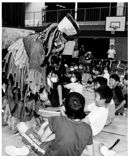
タイのなまはげ“ピーターコーン”

9月18日(金)、清水台小学校に、タイ王国大使館員らが訪れ、全校児童と交流会が行われました。これは、区独自の市民科の授業で、国際理解教育の一環として行われました。