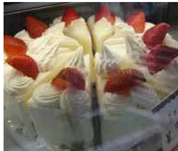
ケーキとパンのお店

お地蔵さまの旗がはためく三つ又商店街の中程、そのお店は戦後からずっとそこにあります。朝は4時から仕込みが始まります。小麦の味とするパンも、具材も全て自家製。スポンジは決してムースでごまかさないシフォンケーキです。