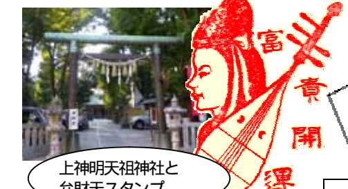
上神明天祖神社と弁財天スタンプ