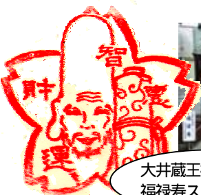
大井蔵王権現神社と福祿寿スタンプ

大井1丁目の大井蔵王権現神社を起点とする荏原七福神を「存じですか？ 郷土・荏原を見直すきっかけにしたいとの願いから平成3年に生まれたという新しいコースです。