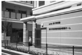
東大井地域密着型多機能ホーム (3/18)