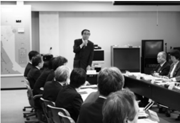
危機管理対策本部 (4/28)

区役所は耐震改修工事中のため駐車スペースに限りがあります。車でご来庁の際はお待ちいただくことがありますので、ご了承ください。