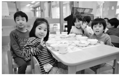
ヘルスケアタウンにしおおいの「キッズタウンにしおおい」(2/14)