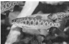
しながわ水族館「東京湾に注ぐ川」リニューアルオープン (7/8)