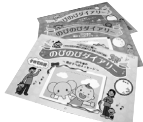
子育て支援「のびのびダイアリー」(3/25)