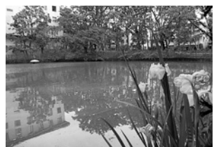
(仮称)国文学研究資料館跡地公園 (5/16)

●区内3カ所目の保水性舗装道路完成(25日) 宮前商店街に、一般舗装道路と比べて10℃程度温度を下げる効果のある、約180メートルの保水性道路が完成しました。