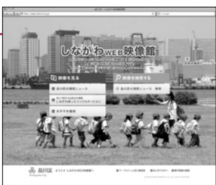
「しながわ WEB 映像館」画面

区ホームページの「しながわWEB映像館」、またはHP www.shina-tv.jp/にアクセスしてください。 園 広報広聴課 ☎5742-6612