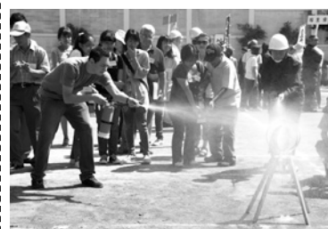
地区総合防災訓練 (9/6)

●龍馬伝サミットの共同開催(26日) 坂本龍馬とゆかりのある全国の九つの自治体の首長が、龍馬にちなんだ地域の活性化やまちづくりの推進などについて熱くアピールしました。