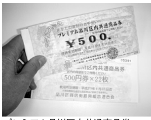
プレミアム品川区区内共通商品券 (4/20)

●危機管理対策本部の設置(28日) 品川区新型インフルエンザ対策事業継続計画(BCCP)に基づき対策本部を設置し、発熱相談センターの設置やBCCPの発動に備えた区民への周知などを決定しました。