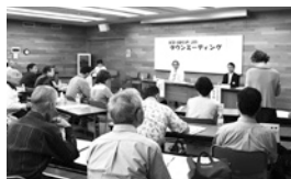
21年度第5回タウンミーティング (9/26)