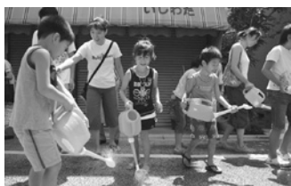
宮前商店街に保水性舗装道路完成 (7/25)