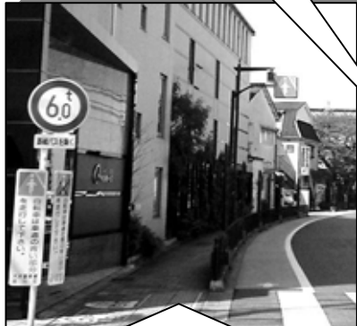
区内ではじめて設置された立会道路の自転車走行レーン

つい歩行者感覚で「右に曲がるから」と自転車なのに逆行してしまつことありますね。気をつけましょう！