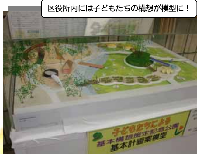
区役所内には子どもたちの構想が模型に!

子どもたちや住民の生の声を採り入れながら建設される、新しい公園ができれば、ぜひ訪ねてみたいものです。