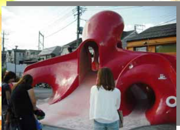
ある土曜日の昼下がり、リニューアルされたタコ公園を訪れてみました。

「小学生たちが考えたコンセプトを今の公園事業に反映させる努力はできる限りしており、今年度末の完成を目指して改修中の鮫洲運動公園には12のアイデアが盛り込まれています」