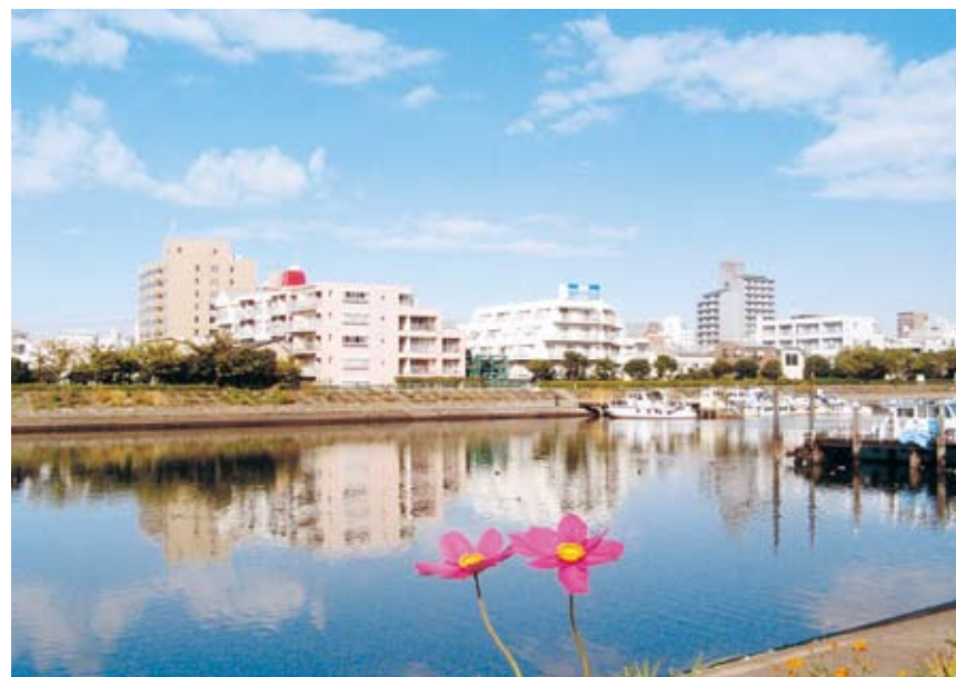
花と緑の公園賞 渡部武雄「秋日和」 しながわ花海道（東大井1・2、勝島1）