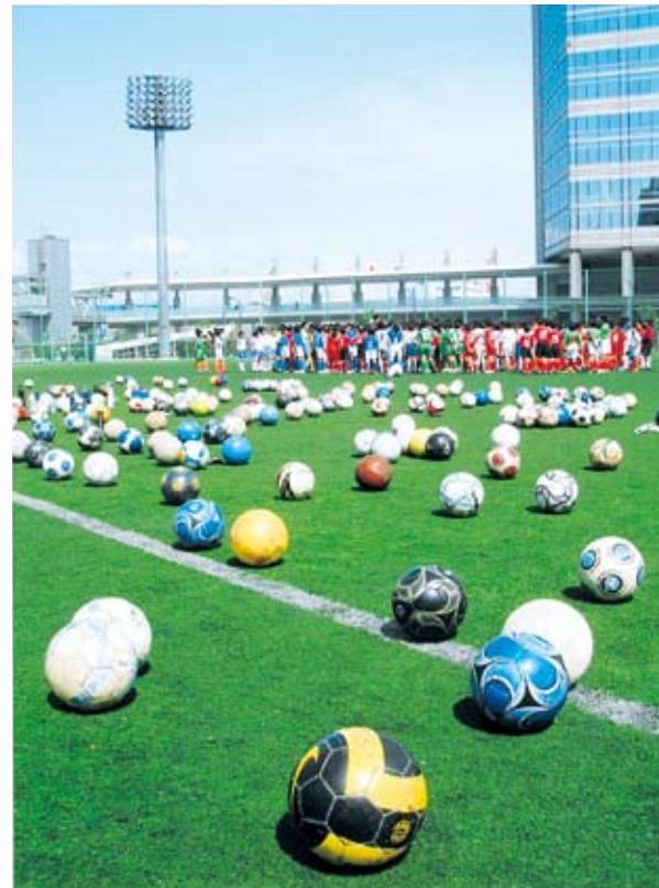
フォトアート賞 田中知二「ピピッ集合」 天王洲公園（東品川2-5・2-6）