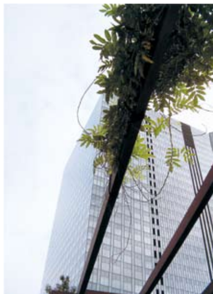
入選 千葉時生（6歳）「はっぱのやねとシンクパーク」 ひびみ公園（大崎2-2）