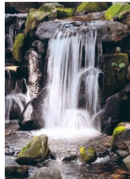
入選 岩垂迪夫「木流れ日の滝」 戸越公園（豊町2-1）