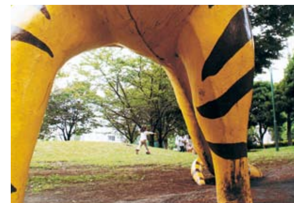
入選 片岩功「待って〜!」 子供の森公園（北品川3-10）