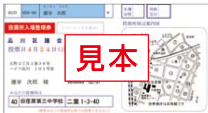
投票所入場整理券