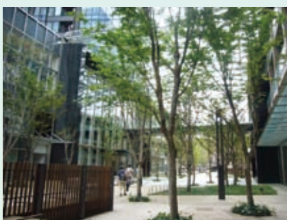
大崎ウエストシティタワーズ (大崎2)