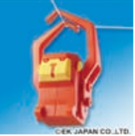
太陽光でロープを渡っていく「ソーラーモンキー」 (ソーラー工作教室)