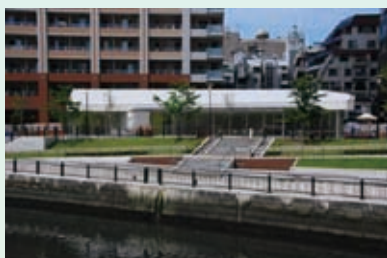
五反田ふれあい水辺広場 (東五反田2)

しながわ区民公園の中にある勝島の海では、桟橋を整備してボート遊びができるようにします。