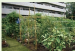
マイガーデン南大井