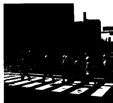
荏原3丁目町会では避難誘導ルートを検証

【荏原3丁目町会】 荏原3丁目町会は、3月13日（日）に災害時要援護者避難誘導ワークショップを開催。3月13日（日）に荏原3丁目町会、荏原4丁目町会、西中延自治会、東中延1丁目町会、平塚1丁目南部町会（いずれも荏原第三地域センター管内）から総勢20名が参加。