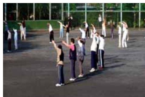
早起きと運動は健康の基本

「昔はバス旅行などもやっていましたけれども、今はもっぱら体操だけです。年会費は一口500円ですが、特に会員でなくても自由に参加していただいても結構です。また、今年は予算に余裕が出てきたので会費は無料にしました」