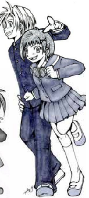
75_H19/03 伊藤学園の魅力に迫る!

たラきあ62直 でスでた号視昔 すトすりのでに ねも。は初きさ !描74イ詣なか 。い、キといの て75才65んぼ い号イ号でる てのがすほ 楽制あ銭がど し服っ湯へ拙 かので、笑く っイ好のて