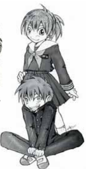
74_H18/12 伊藤中・原小のすたるじあ

いべく!紙がかぎもルなで120さて でン、ルにきもな大にがす%れ、漫 すで黒ペ、サ。いき投スよ位る雑画 よ描イン鉛イAの稿ク!でサ誌の くんで筆ズ5が描すラ 描イで原 。とクはや位)コきるンみくズ印稿 いのなボのはツす時ブんの刷っ