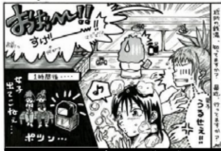
65_H16/09 スポーツの秋と銭湯!?

使はマ・ま3ラ っ漫丸す スク て画チペ。5トク い用ランペ時1ラ ま原イ・ン間枚ン す稿ナコは位はブ 。用ピG掛、ル 紙、ッペか大の を紙クンリ体イ