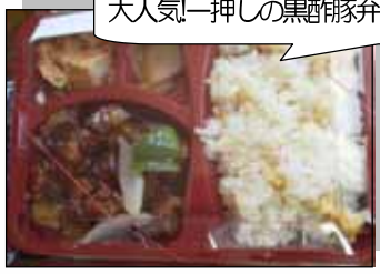
大人気! 押ししの黒豚豚弁当

お昼にはお店の前になんと500円でスープ付きのお弁当が並びます。50食20種類位を毎日(日曜除く)販売しているそうです。