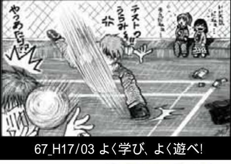
67_H17/03 よく学び、よく遊べ!

凡例 67_H17/03 67号 平成17年3月発行 61~68号：この町に遊べ!! 地域ボランティア: 64号表面記事、グラフィながわ 伊藤中・伊藤学園の制服: 74・75号表面記事 バックナンバーは インターネットで閲覧で きます。一度ご覧下さい。