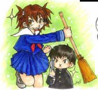
64_H16/06 地域ボランティア