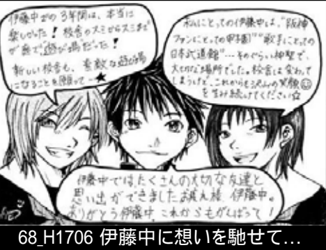
68_H1706 伊藤中に想いを馳せて...

×4いう印 90面にて刷ス mmのい、がク でイまほキラ 描らしぼレン いした原イブル てト。寸にル まは今大出で す、回では 。138の描よ、