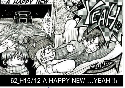
62_H15/12 A HAPPY NEW ...YEAH!!

どとなに友なをたわ ねはにな達感取んつ 思長りをじりてでて !つくま誘で入すみ て携しつへれ。な なわて笑た、い がる。参い若か っこま加。!いと たとさすそ、人誘 でにかるれみのわ すなこよでた感れ けるんう、い性