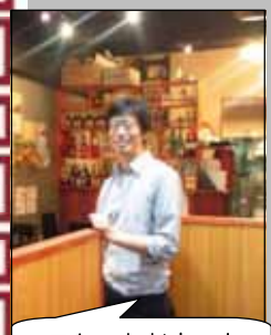
マスターとお店の中

本格中国料理店の味を、親しみやすい雰囲気とお値段で提供しているお店。身体に優しい薬膳メニューもあり、子どもたちにもフレンドリー♪(マスターは伊藤学園PTA)