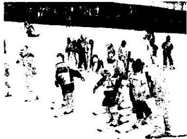
スキーの練習に励む子どもたち

当日はバス3台を連ね、午前7時に武蔵小山を出発。現地までの車内では、バスレク長を中心に手作りのゲームなどを楽