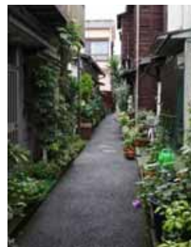
幅員が4m未満の狭い道路

細街路など脆弱な都市基盤と木造住宅の密集など防災性の課題が大きい当ゾーンでは、建築物の共同化などにより耐震化、不燃化を促進するとともに、細街路の拡幅整備の推進や防災生活道路の整備を進め、災害に強く安全な市街地の形成を図る。また、地域の特徴でもある小工場と居住の混在する市街地については、住宅、工場が適切に調和したまちづくりを進める。