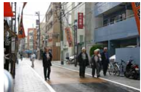
旧東海道の街並み

旧東海道を中心に、寺社等の歴史的な景観資源が多く分布する当ゾーンでは、景観計画に基づく重点地区の指定や街並み誘導型地区計画の活用により、継承された歴史ある街の風情や伝統を活かした旧東海道沿道にふさわしい街並み景観の形成と、商店街や住宅を中心とした魅力とにぎわいのある複合市街地の形成をめざす。