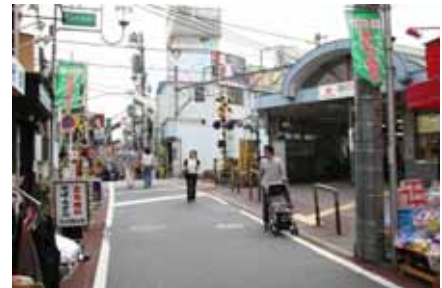
旗の台駅周辺の街並み

区民のより身近な生活活動を支える拠点となる当ゾーンは、駅を中心に個性ある商店街や、地域の生活やコミュニティを支える医療、福祉、子育て支援、集会施設など生活関連機能の集積を図るとともに、歩行者空間のバリアフリー化や公園や街路樹など身近な都市空間の緑化を進め、にぎわいのある便利で快適に歩いて暮らせる市街地の形成を図る。