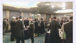
プレゼン付会員交流会(平成24年3月28日)