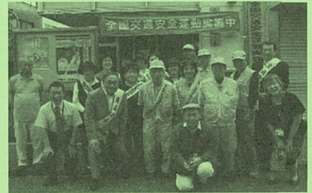
9月21日(金)~30日(日)まで、恒例の秋の全国交通安全運動が行われ、荏原第一管内の各町会でも、啓発活動が行われました。