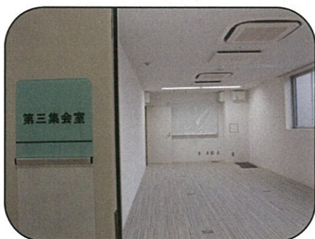
机・イスが入ります