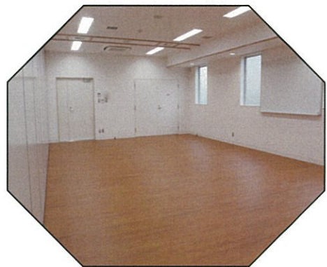
机・イスが入ります