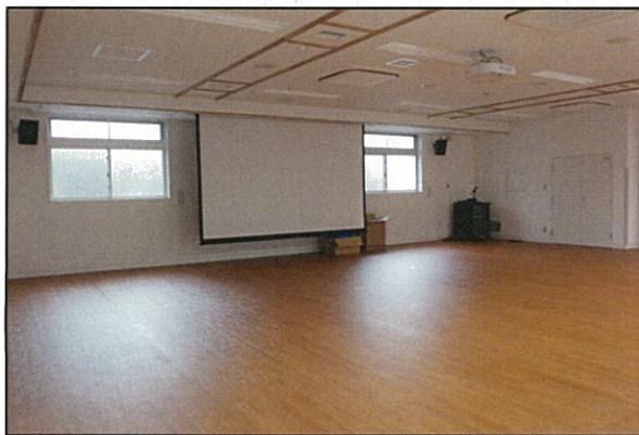
机・イスが入ります