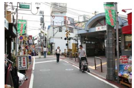
旗の台駅周辺の街並み

区民のより身近な生活活動を支える拠点となる当ゾーンは、駅を中心に個性ある商店街や、地域の生活やコミュニティを支える医療、福祉、子育て支援、集会施設等、生活関連機能の集積を図るとともに、歩行者空間のバリアフリー化や公園や街路樹等、身近な都市空間の緑化を進め、にぎわいのある便利で快適に歩いて暮らせる市街地の形成を図る。