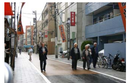
旧東海道の街並み

旧東海道を中心に、寺社等の歴史的な景観資源が多く分布する当ゾーンでは、景観計画に基づく重点地区の指定や街並み誘導型地区計画 60 の活用により、継承された歴史ある街の風情や伝統を活かした旧東海道沿道にふさわしい街並み景観の形成と、商店街や住宅を中心とした魅力とにぎわいのある複合市街地の形成をめざす。