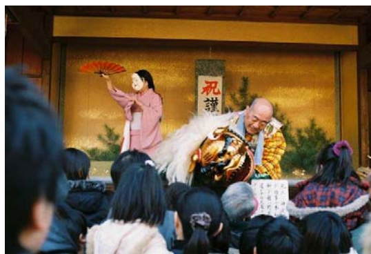
旗岡八幡神社での寿獅子