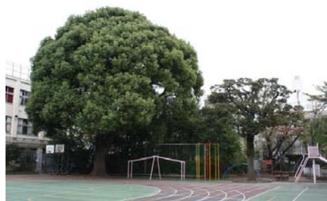
中延小学校の大楠と中延の森

公園周辺や街路樹植栽のある道路の沿道では、公共施設のみどりと民有地の緑化の連携を図り、みどり豊かな街並みの形成を促進する。また、地域のシンボルとなる樹木においては、道路からの見え方にも配慮した景観の保全を図る。