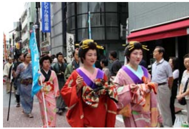
旧東海道での宿場まつり