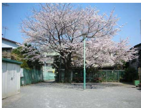
荏原一丁目防災広場の桜

密集市街地改善ゾーンでは、既存の樹木の活用、ポケットパーク等での緑化、シンボルツリーの配置、低い塀や生け垣による開放性のある空間形成等を、防災まちづくりと連携して促進する。