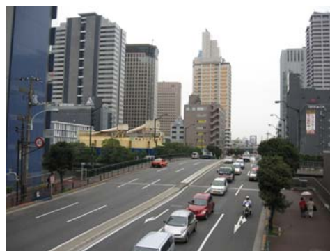
幹線道路での緑化（天王洲）

品川区みどりの条例や開発環境指導要綱 97 等による民間建築物の建築指導とあわせて、幹線道路等においても街路樹等の効果的な配置を行い、沿道建築物等周辺市街地の景観との一体性を保ちつつ道路の景観を整備し、沿道空間のアメニティ性の向上を促進する。