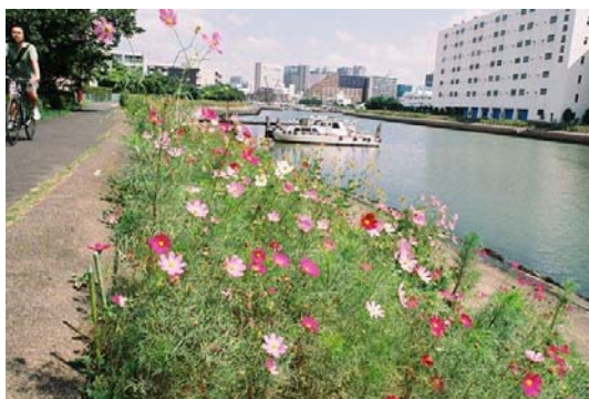
コスモスが咲くしながわ花海道

水辺景観形成特別地区や運河、目黒川、立会川等の水辺については、水辺に面したオープンスペースの設置や植栽等を活かした親水空間の整備、水辺からの眺望に配慮した景観形成を進めていく。