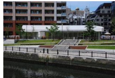
五反田ふれあい水辺広場