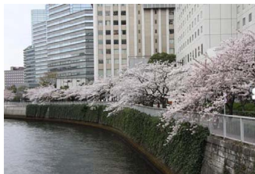
目黒川沿いの桜並木