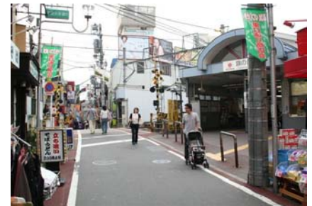
旗の台駅周辺の街並み

区民のより身近な生活活動を支える拠点となる当ゾーンは、駅を中心に個性ある商店街や、地域の生活やコミュニティを支える医療、福祉、子育て支援、集会施設等、生活関連機能の集積を図るとともに、歩行者空間のバリアフリー化や公園や街路樹等、身近な都市空間の緑化を進め、にぎわいのある便利で快適に歩いて暮らせる市街地の形成を図る。