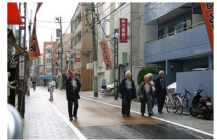
旧東海道の街並み

旧東海道を中心に、寺社等の歴史的な景観資源が多く分布する当ゾーンでは、景観計画に基づく重点地区の指定や街並み誘導型地区計画 ※ の活用により、継承された歴史ある街の風情や伝統を活かした旧東海道沿道にふさわしい街並み景観の形成と、商店街や住宅を中心とした魅力とにぎわいのある複合市街地の形成をめざす。