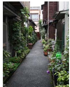
幅員が4m未満の狭あいな道路

細街路等、脆弱な都市基盤と密集した木造住宅等、防災性の課題が大きい当ゾーンでは、建築物の共同化等により耐震化、不燃化を促進するとともに、細街路の拡幅整備の推進や防災生活道路 ※ の整備を進め、災害に強く安全な市街地の形成を図る。また、地域の特徴でもある工場と住居の混在する市街地については、住宅、工場が適切に調和したまちづくりを進める。