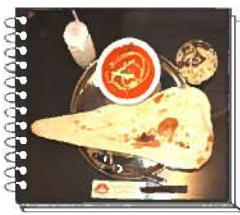
チキンカレーセット ¥830

インドから24種類のスパイスを取り寄せた本格的なエスニック料理が楽しめるお店。人気のランチセットをご紹介します！カレーは辛さが5段階から選べ、本格炭火タンドール釜で焼き上げるナンは香ばしさの中にも甘味があり美味しかったです🍀