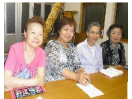
荏原2丁目町会婦人部の皆さん

所にあわせ、7つのスタンドパイプホースセットが設置されています。スタンドパイプホースセットの収納箱には鍵がかかっておらず、有事の際には誰でも使用することが可能になっています。スタンドパイプの操作は、複雑ではなけれど、「誰かに一度教えてもらわなければできなかった」と参加者の皆さんも熱心に見学され、実際に体験しました。