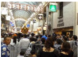
商店街を神輿が練り歩く(両社祭)