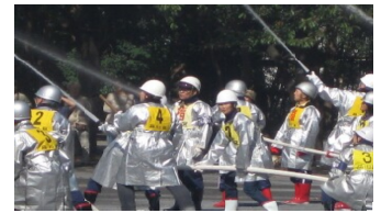
昨年の防災訓練の様子

荏原第一管内そろって総合防災訓練 「自分たちの町は自分たちで守る」を実践 【日時】10月20日(日) 9時～11時50分 【会場】林試の森「大きな広場」 品川区防災協議会・荏原第一地区協議会主催による総合防災訓練が行なわれます。例年、10000人を超える参加者があり、様々な実践コーナーで、体験しながら防災の意識を高める事ができます。各町会を中心に、どなたでも参加できる訓練です。一時集合場所、時間などについては、各町会の掲示板や回覧板などでお知らせします。皆さま、ふるってご参加下さい。