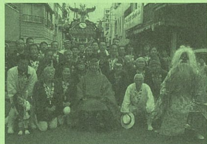
小山台2丁目町会宮神輿の関係の方々