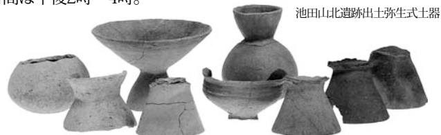
池田山北遺跡出土弥生式土器

日16歳以上の方100人(抽選) 料1,000円(観覧料別) 日1月31日(金)(必着)までに、往復はがき(1人1枚)に「歴史講座希望」とし住所、氏名、年齢、電話番号を同館へ