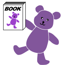
品川区子ども読書活動推進PRキャラクター「ブックまくん」

子ども時代の読書は心を豊かにし、生きる力を育みます。 図書館では、「子ども読書の日」にちなんで様々な催しを開催します。 ぜひ、お子さんと一緒にお近くの図書館へお出かけください。 問い合わせ/品川図書館(北品川2-32-3 ☎3471-4667) ※イベントに参加されたお子さんにはブックまくんグッズをさし上げます!