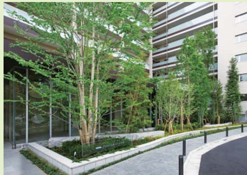
緑化大賞 「プラウド大井ゼームス坂」(南品川15)