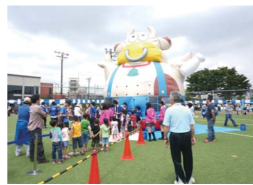
ふわふわ空気ドーム

水しか排出しない次世代エコカーです。 ①午前10時30分～11時30分 ②午後1時30分～3時