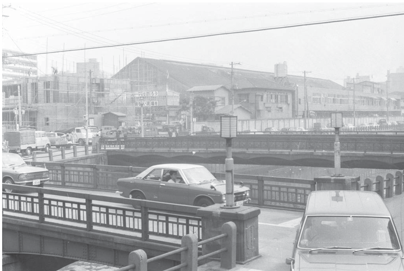
亀の甲橋と市場橋 (昭和44年 (1969) 9月撮影)