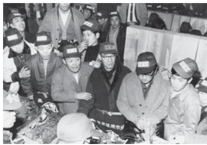
セリが行われる前、商品の品定めをしている青果店の人たち。帽子については屋号(店の名前) (昭和41年 (1966) 2月撮影)

真左の建設中の建物も市場の一部です。手前の亀の甲橋には車が走っています。今は歩行者専用の橋です。また、亀の甲橋の奥に