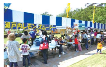
出店ブース(模擬店)の様子