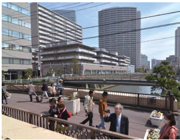
現在の亀の甲橋から下流に広がる風景 (平成26年 (2014) 3月撮影)