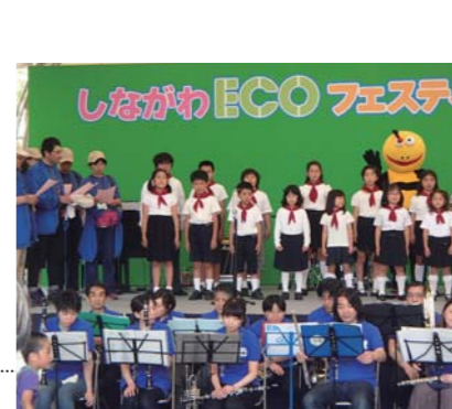
ステージでの発表