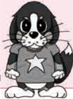
防犯マスコット「しなぼう」

※詳しくはお問い合わせください。 回 地域活動課生活安全担当☎5742-6592