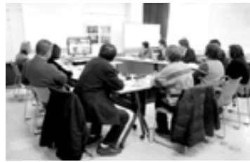
記者同士の情報交換会も年3回開催しています

対象 ／区内在住・在勤・在学で、環境問題に関心のある方（中学生以下は保護者の許可が必要） 登録期間 ／1年間（4～3月。年度途中で登録した方は翌年度3月末まで）※翌年度も自動継続して登録。ただし1年間情報提供がない場合は、自動的に登録抹消。 応募方法 ／登録申請書をEメール（center@shinagawa-eco.jp）か、郵送（〒140-8715品川区役所）で同センターへ※申請書はセンターホームページからダウンロードできます。 「庭のアジサイの花が咲きました」といった花の開花情報、地域の環境イベント情報、環境活動など、身近な環境情報をメールなどで配信可能な「環境記者」を募集しています。提供いただいた記事や写真は、ホームページなどに掲載します。