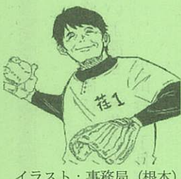
イラスト:事務局(根本)

小山台高校野球班出身の私が、センバツ甲子園に出場した年に、ここへ異動になったことにとっても不思議な縁を感じています。自分を育ててくれたこの地域のために、微力ではありますが、全力で全力投球の精神で頑張ります。どうぞよろしくお願ひします。