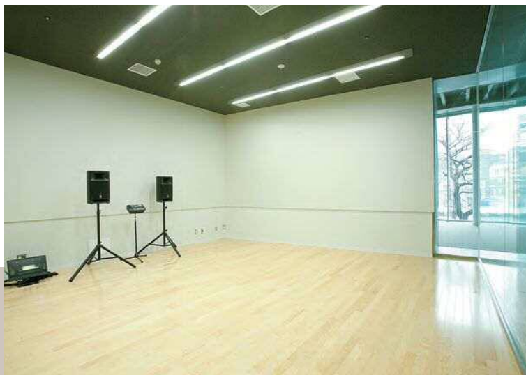
第2スタジオ [39㎡ 定員30名]

音楽活動やダンスの練習、ホール楽屋としても利用可能です。(アップライトピアノ 配備)