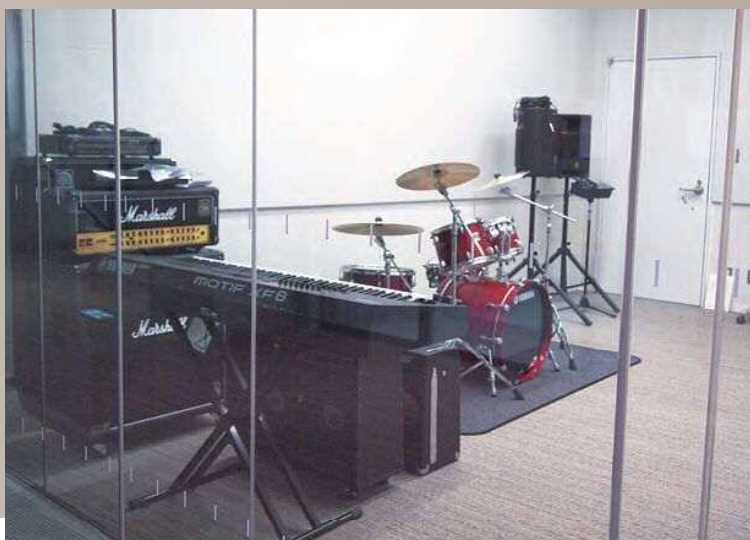
第3スタジオ [25㎡ 定員10名]

バンド練習など、音楽活動にご利用いただけます。(ドラムセット・キーボード 配備)