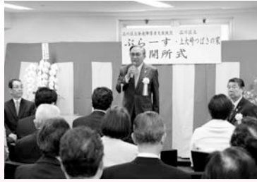
ぶらーす、上大崎つばさの家開所 (3/28)