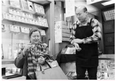
英語少し通じます商店街プロジェクト (4/3)

☎140-8715 品川区広町2-1-36 代表番号 ☎3777-1111 広報広聴課 ☎5742-6644 Fax5742-6870 http://www.city.shinagawa.tokyo.jp/