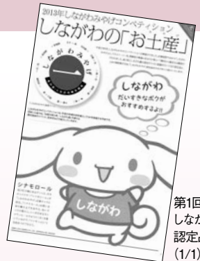
第1回 しながわみやげ認定品発表 (1/1)