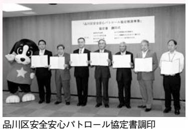
品川区安全安心パトロール協定書調印 (9/10)