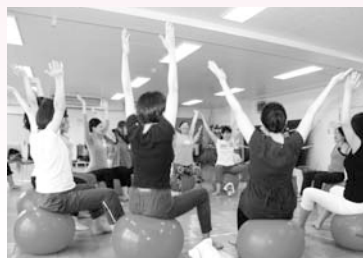
プレママプラチマタウン (9/20)