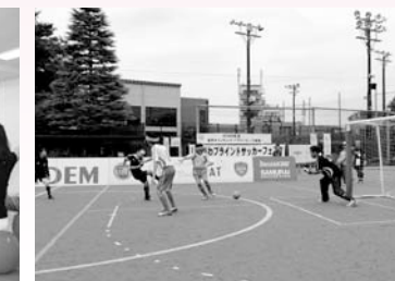
ブラインドサッカーフェスタ (9/15)