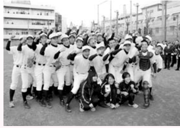
小山台高校野球班甲子園大会出場 (3/21)