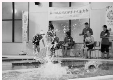
第1回障害者水泳大会 (9/23)