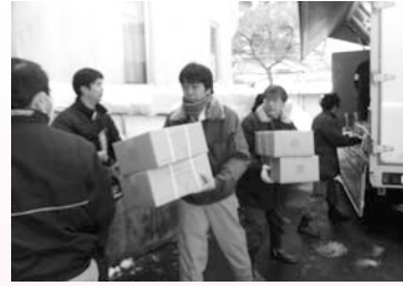
大雪被害の早川町に救援物資搬送 (2/20)