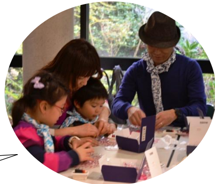
桔梗屋工場で、信玄餅の包装体験♪

昼食の後は、勝沼ぶどう郷・見晴らし園でぶどう狩り。秋晴れの山梨を思う存分味わいました。