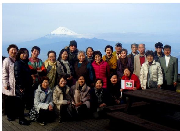
新年会で伊東へ 富士山を背に記念撮影

「学ぶ・楽しむ」の コーナーは、荏原第五 地区で活動する団体の 紹介をしています。 掲載を希望する団体は 荏原第五地域センター (☎3785-2000) まで