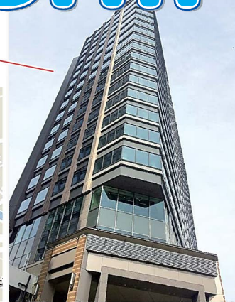
大崎ブライトコア外観