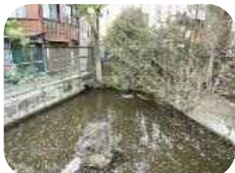
→稲荷の守護神か？ 池の主か？

■ 滝王子 ■ 滝王子稲荷や池のある 大井五丁目付近。この地 に「滝さん」という長者 が住んでいて、王子権現 をまつたので「滝王 子」となったそう。