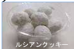
ルシアンクッキー

明るく清潔な厨房では3名の方が専用の作業着や帽子・マスクを手袋を着用し、午前中に焼き上げたお菓子の袋詰め作業をされていました。 ルシアンクッキー は卵不使用で、ころんと丸い、ふわっさくとした口どけの軽い焼き菓子です。プレーン・ごまきなこ・抹茶の3種類があり、ちょっとしたプレゼントにもおすすめです。