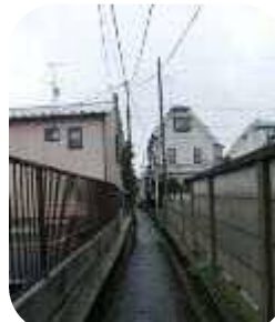
→水路の面影がある 路地が残っています。

■ 品川用水 ■ 江戸時代、水不足 のため、調布から玉 川上水を分水して約 28kmの品川用水が 作られた。 今ではほとんどが 埋め立てられ路地に なっています。上記 のケヤキ並木沿いの 歩道もその跡です。