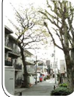
←木もれ日が心地良い ケヤキ並木。

■ おまけ ■ 明治の頃、今の大井 町駅前には大きな工場が あった。たくさん女の人 が働いていたが、買物に 行く時間がとれないため お給料日になるとお店が 出るようになった。 それが大井町の縁日の 始まりだそう。