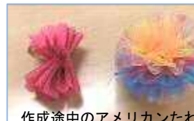
作成途中のアメリカンたわし

まず6枚のチュールを重ねて真ん中から縫い合わせ、糸をきゅっとひっぱって縛り1枚ずつお花のように広がっていきます。一度広げたらさらにもう一度ふわっと広げる作業を繰り返して、最後は丸いボール状になるようにハサミ切りそろえて完成です。