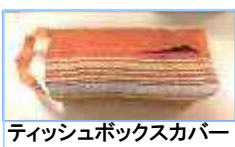
ティッシュボックスカバー

私達が取材をしている間も、地域の方が代る代る販売所を訪れていました。また、案内してくださったスタッフの「地の方のご理解ご協力なしでは成り立たない活です。皆さんに温かく見守って頂き感謝してります」という言葉がとても印象に残りました。障害を持つ方々と地域社会をつなぐ交流の場として、このかもめ第二工房は大切な役割を担っているのです。みなさんも、ぜひお気軽にお立ち寄りください。