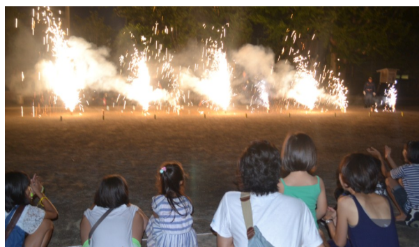
荇原消防団第五分団の皆さんに協力して頂いて花火を楽しみました

スポーツを楽しんだ後には、グラウンドで地区委員さんお手製カレー・コロッケ・かき氷、そして杜松ホームからの差し入れでデザートをいただき、施設利用者の方も美味しそうに食べていました。