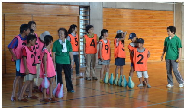
チーム対抗ガラッキー大会

ラジオ体操で体をほぐした後、体育館とグラウンドで健康づくり推進委員の協力のもと、ガラッキーとわなげを楽しみました。ガラッキーはチーム対抗戦を行い、優勝チームには豪華賞品がプレゼントされました。子どもから高年者までチーム一丸となり、初めて会った人同士でも自然と会話が弾み笑顔があふれていました。