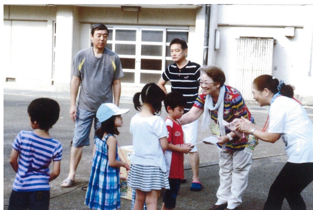
ラジオ体操で町内の子どもたちとの交流を楽しむ大淵会長(右から2番目)

夏の行事の区民まつり、昨年工事中で出来なかった杜松ホームでのラジオ体操も大勢の方に参加していただき無事終わりました。今後ますます町内の絆を深めていきたいと思ひます。