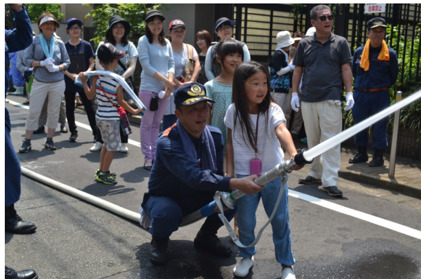
荏原消防団第六分団の皆さんに指導して頂きました