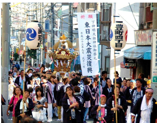
下神明天祖神社祭礼での神輿

「学ぶ・楽しむ」のコーナーは、荏原第五地区で活動する団体の紹介をしています。掲載を希望する団体は荏原第五地域センター(☎3785-2000)まで