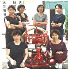
ポンプ隊のみなさんとパチリ

私は1番員を担当することになりました。隊員はそれぞれ、1番員は放水、2番員は中継・連絡、3番員はポンプ操作を担当します。私もポンプ隊の皆さんも緊張が高まります。指揮者の「集まれー」の声で集合し、「操作始め！」に対し、「よし！」と答え、1番員の私は、右手にホース、左手に筒先を持って走ります。ポンプと火点との間に着いたら、二重巻きのホースを地面に置いて、転がすようにホースを延ばします。これは結構コツがいります。筒先をしっかりと持ち、火点を想定した場所に放水開始！！