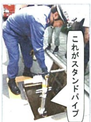
これがスタンドパイプ

路上の黄色い線で囲まれた四角い蓋を開くと消火栓が現れます。ここにスタンドパイプを接続し、ホースをつなげ、ドライバーでゆっくり栓を開けていくと放水の準備完了です。見た目よりも軽量で、女性でも簡単に持つことができます。スタンドパイプは地域の防災倉庫や学校に準備されています。