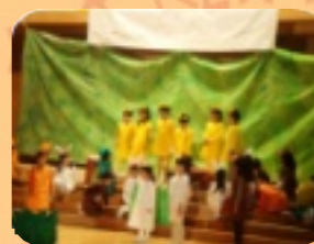
1年生 赤いろうそく