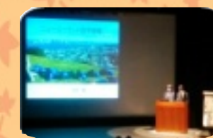
ニュージーランド研修報告