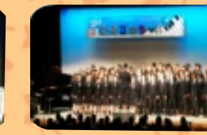
8学年合唱『時の旅人』