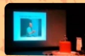
広島平和使節派遣報告