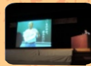
広島平和使節派遣報告