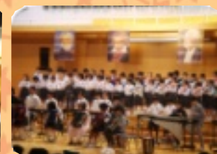
3年生 クラシック・ワールド