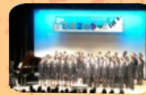
7学年合唱『明日の空へ』