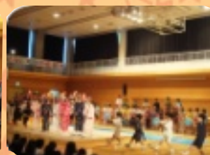
4年生 ビューティフル日本